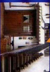
Rte. El Callejón de los Gatos C/ Guzmán El Bueno s/n