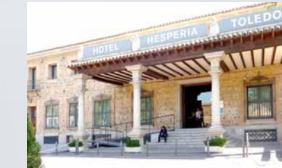
Hotel Hesperia Toledo C/ Marqués de Mendigorría 3-12