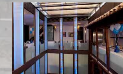
Restaurante Alfileritos C/ Alfileritos 24